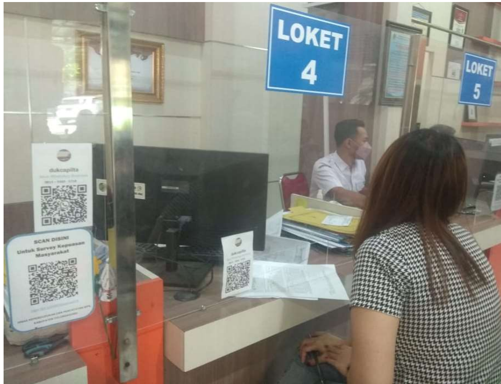
Tiap-tiap sudut loket pelayanan sudah menyiapkan scan barkode pengisian survei Kepuasan Masyarakat melalui Aplikasi E-Sukma